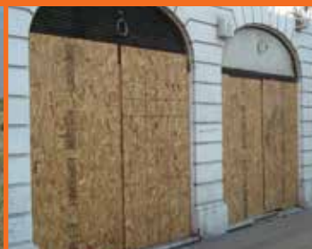
IDENTIFICACIÓN DE OBRAS